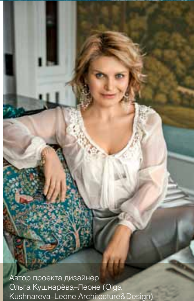
Автор проекта дизайнер Ольга Кушнарёва-Леоне (Olga Kushnareva-Leone Architecture&Design)