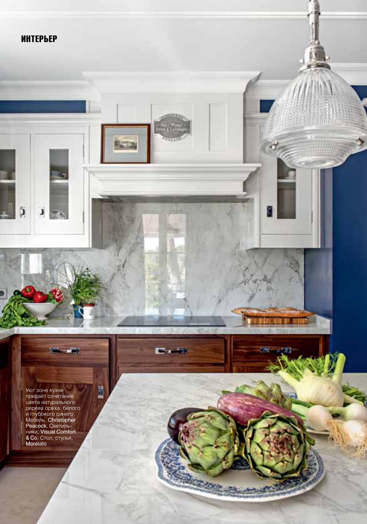
Уют зоне кухни придаёт сочетание цвета натурального дерева ореха, белого и глубокого синего. Мебель, Christopher Peacock. Светильники, Visual Comfort & Co. Стол, стулья, Morelato