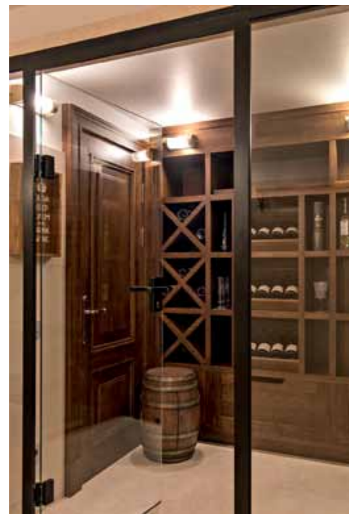
Слева Винный погреб находится в цокольном этаже дома, где также расположены сезонная гардеробная, кладовые и санузел при бассейне. Мебель для винного погреба была разработана и создана из натурального дерева по индивидуальным чертежам команды проекта