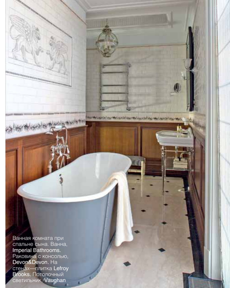
Ванная комната при спальне сына. Ванна, Imperial Bathrooms. Раковина с консолью, Devon&Devon. На стенах—плитка Lefroy Brooks. Потолочный светильник, Vaughan