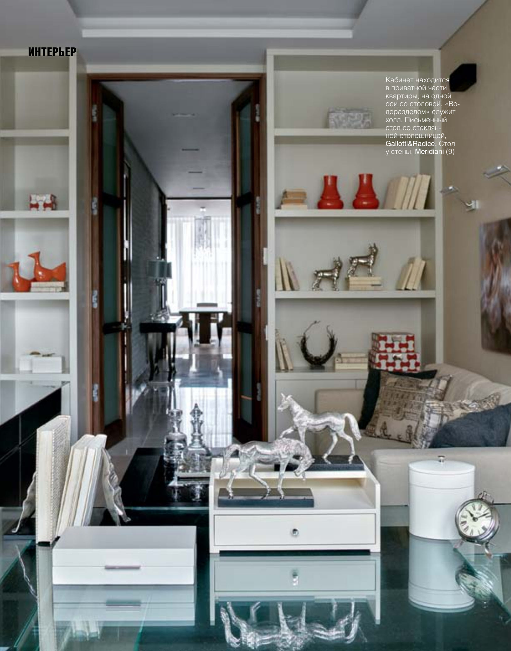
Кабинет находится в частной части квартиры, на одной оси со столовой. «Водоразделом» служит холл. Письменный стол со стеклянной столешницей, Gallotti&Radice. Стол у стены, Meridiani (9)