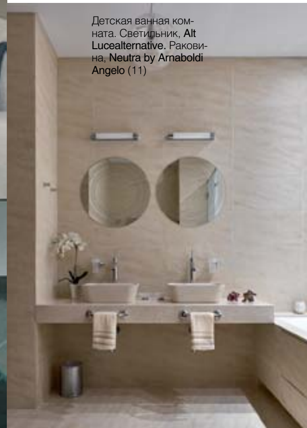
Детская ванная комната. Светильник, Alt Lucealternative. Раковина, Neutra by Arnaboldi Angelo (11)

«Идея просторных и величественных интерьеров очень удачно поддержана масштабом дверей»