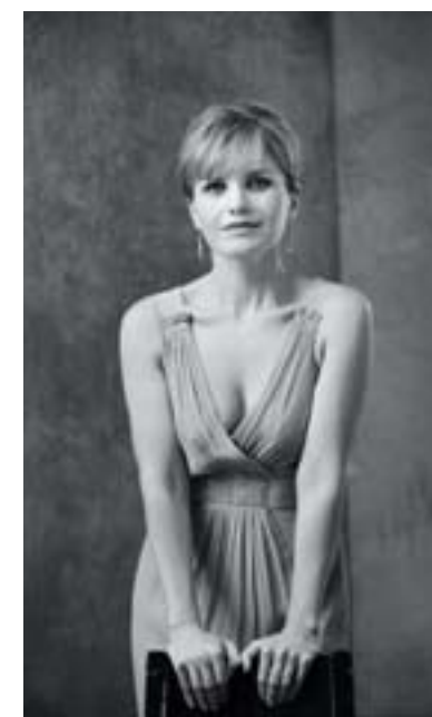
Портфолио дизайнера http://archiprofi.ru/allportfolio/olga-kushnareva/

«Настрой заказчиков на современный интерьер был очень серьёзным и осознанным. Только в конце работы хозяйке всё же захотелось смягчить полученный результат, и мы внесли некоторые изменения уже на стадии отделки. Задуманный как достаточно «жёсткий» по формам и материалам и монохромный (предполагалось много чёрного, белого и серого), интерьер стал значительно мягче. Так, вместо чёрных лаковых панелей и стекла в зоне камин и в холле у нас появилась отделка клинкерным кирпичом, а светильники были заменены на менее «концептуальные»