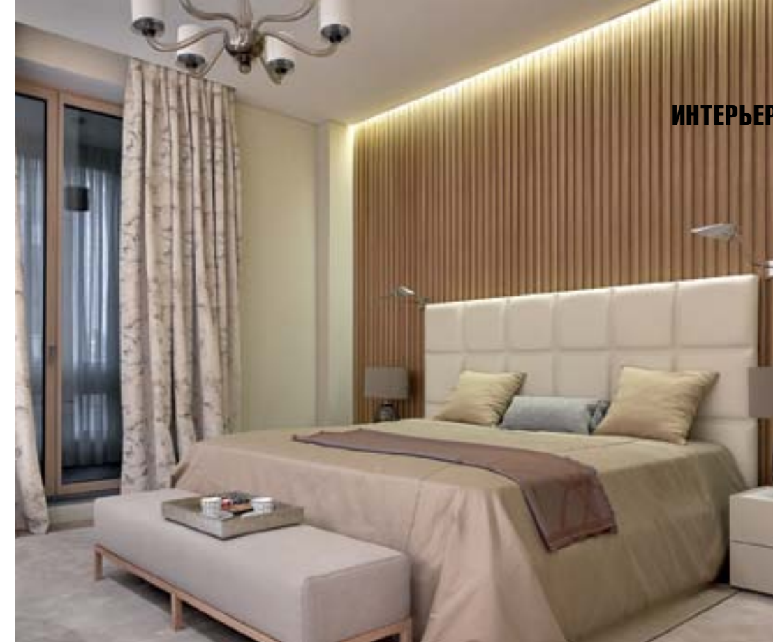
Спальня хозяев и ванная комната при спальне демонстрируют, каким образом при лаконизме и строгости форм можно создать в интерьере ощущение расслабленной неги. Изысканная палитра, натуральные, приятные на ощупь материалы. Кровать, Cattelan Italia. Банкетка, Meridiani (10)